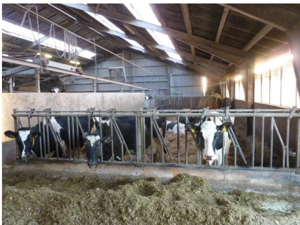
Figur 9: Den store sygeboks er placeret ved siden af opsamlingspladsen.

Besætningen har en sygeboks på 85 m 2 inkl. ædeplads (figur 9). På besøgsdagen gik der 12 køer i boksen. Sygeboksen er placeret i separat bygning ved siden af malkestald og opsamlingsplads. Derudover er der en mindre sygeboks på omkring 20 m 2 (ej opmålt). Her gik der to køer på besøgsdagen. Denne sygeboks er placeret i en anden bygning som også huser nykælvare og malkende køer.