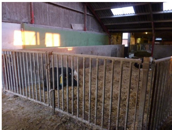
Figur 10: Sygeboksen på omkring 20 m 2 .