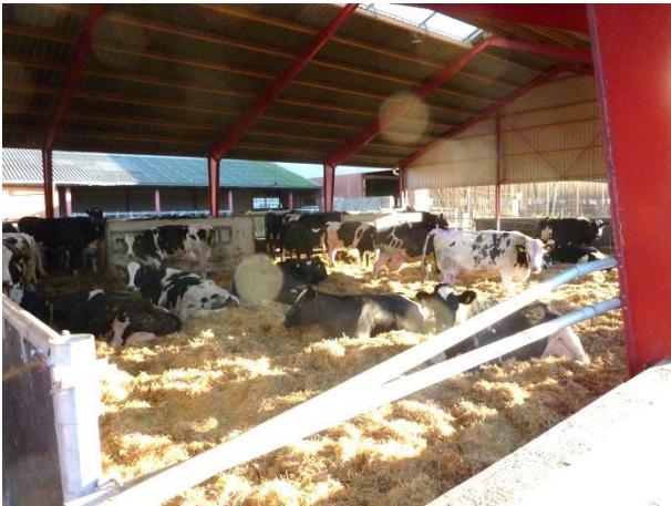
Figur 3: Sygeboks med 217 m 2 dybstrøelse og tilhørende ædeplads på 89 m 2 .

Besætningen har to sygebokse. Den store sygeboks er på 217 m 2 dybstrøelse og tilhørende ædeplads på 89 m 2 (figur 3). I den store sygeboks gik der 38 køer på besøgsdagen. Den lille sygeboks er på 24 m 2 dybstrøelse og i denne boks gik der 6 køer/kvier på besøgsdagen.