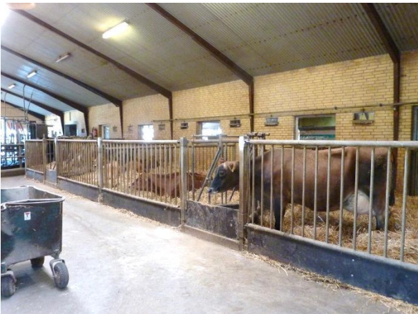
Figur 11: De fire syge-/opstartsbokse.

Besætningen har fire sygebokse (figur 11). Hver boks er på 15 m 2 (figur 12). På besøgsdagen gik der to køer i hver boks. Ifølge besætningen må der max gå to køer i hver boks. Sygeboksene er placeret ved siden af malkekarrusellen og op mod gangen med servicefaciliteterne (kontor og opholdsstue). Stalden er fra 2007 og boksene er oprindeligt født som sygebokse.