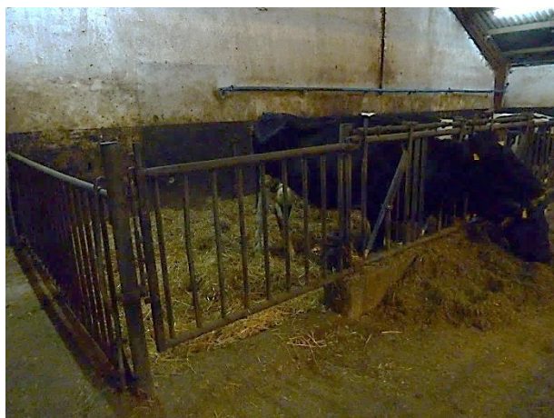
Figur 6: Sygeboks på 20 m 2 .