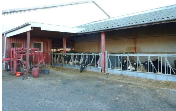
Figur 4: Til højre for den røde stolpe ses den lille sygeboks på 24 m 2 . Derefter kommer et separationsafsnit. På billedet ses også klovbeskæringsboksen.