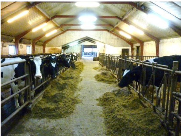
Figur 7: Syge-/opstartsboks til højre og separationsafsnit til venstre.

Besætningen har en syge- og opstartsboks på 97 m 2 (figur 8). På besøgsdagen gik der otte køer i boksen. Syge-/opstartsboksen er placeret i en mellembygning som ligger op til malkestald og opsamlingsplads. Kostalden ligger i forlængelse af opsamlingspladsen og kalve- og ungdyrstalden ligger i forlængelse af mellembygningen.