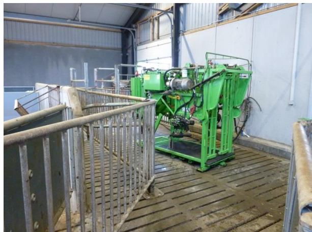
Figur 15: Ved siden af sygeboksen og lige o nærheden af malkestalden, er der en permanent placeret klovbeskæringsboks.