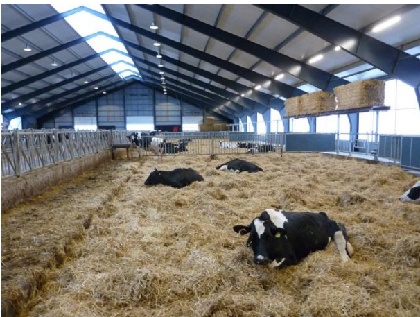
Figur 14: En 200 m 2 stor syge- og opstartsboks.

Besætningen har opført et nyt staldanlæg med to stalde. I den ene stald er der malkende køer. Den anden stald består af sengebåse på den ene side af foderbordet og dybstrøelse på den anden side af foderbordet. Cirka halvdelen af dybstrøelsen er to fælles højdrægtighedsområder med tilhørende enkeltkælvningsbokse, til henholdsvis højdrægtige kvier og køer. Resten af dybstrøelsen er en 200 m 2 stor syge- og opstartsboks (figur 14). På besøgsdagen gik der seks køer i boksen. I de 200 m 2 er der inkluderet inventar til to separate sygebokse som kan slås ud ved behov. Ved siden af sygeboksen er en permanent placeret klovbeskæringsboks med tilhørende drivgang (figur 15). Sygeboksen er placeret i forlængelse med malkestald og opsamlingsplads.