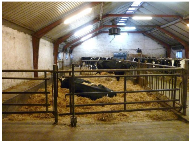
Figur 8: Syge-/opstartsboksen på 97 m 2 .