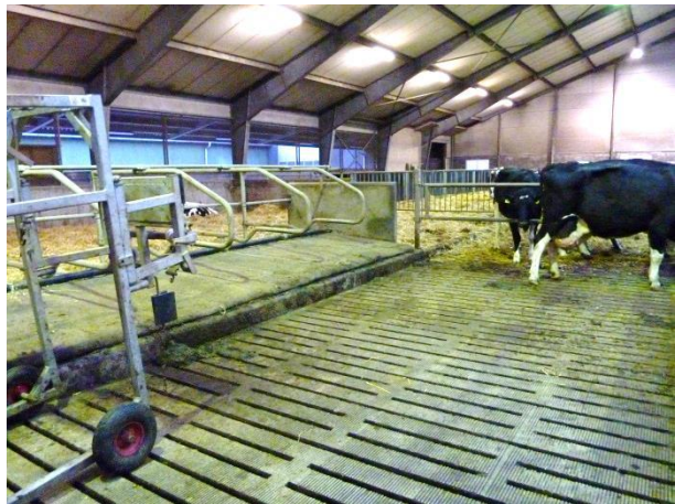
Figur 15: Separationsafsnit med seks senge og klovbeskæringsboks.