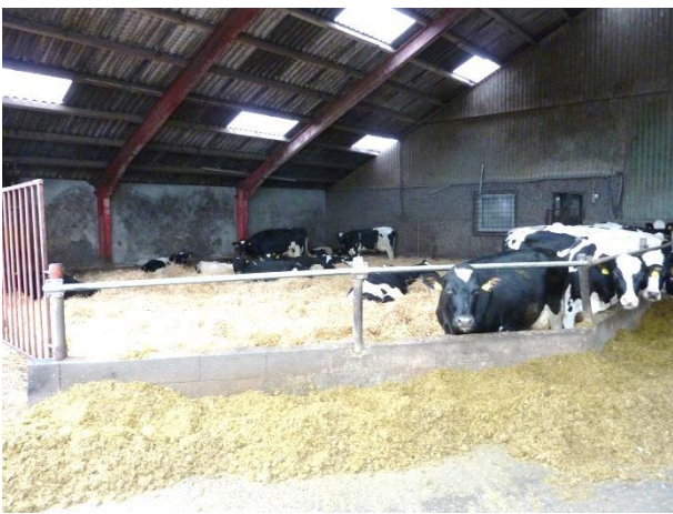
Figur 1: Syge- og opstartsboks

Besætningen har en syge- og opstartsboks. Boksen er på 175 m 2 . På besøgsdagen gik der 21 køer i boksen.