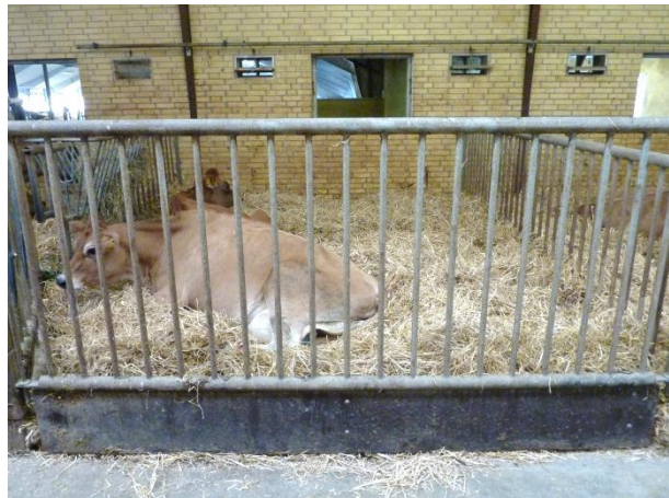
Figur 12: En af de fire syge-/opstartsbokse.

I stalden er der et nykælverhold, et 1. kalvshold, et øvrige (gammelkoshold) og et celletalshold. I celletalsholdet går de dårligste celletalskøer og evt. halte køer. Der må max gå 20 køer og der er 25 senge. Der er to vandkar og en kobørste.