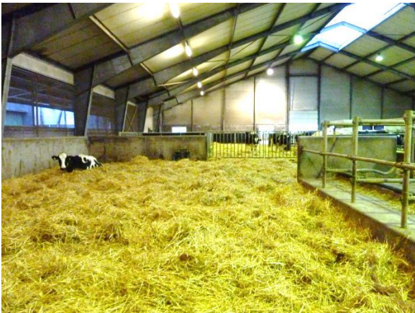
Figur 14: Syge- og opstartsboksen.

Besætningen har en syge- og opstartsboks på 120 m 2 dybstrøelse og tilhørende ædeplads på 23 m 2 (figur 16). På besøgsdagen gik der fire køer i boksen. Boksen er placeret bag ved en robot i kostalden. Lige op af syge-/opstartsboksen er et separationsafsnit med seks senge og tilhørende ædeplads (figur 17). I forlængelse af syge-/opstartsboksen ligger et fælles højdrægtighedsområde med tilhørende enkeltkælvningsbokse.