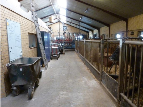
Figur 13. Vinduet i kontor og opholdsstuen vender lige ud mod syge-/opstartsboksene.